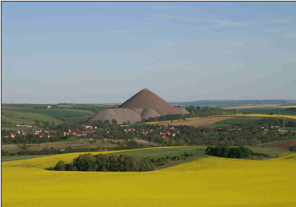
Eine der Mansfelder Pyramiden – die Halde des ehemaligen Fortschrittschachtes bei Lutherstadt Eisleben (Blick vom Zirkelschacht).