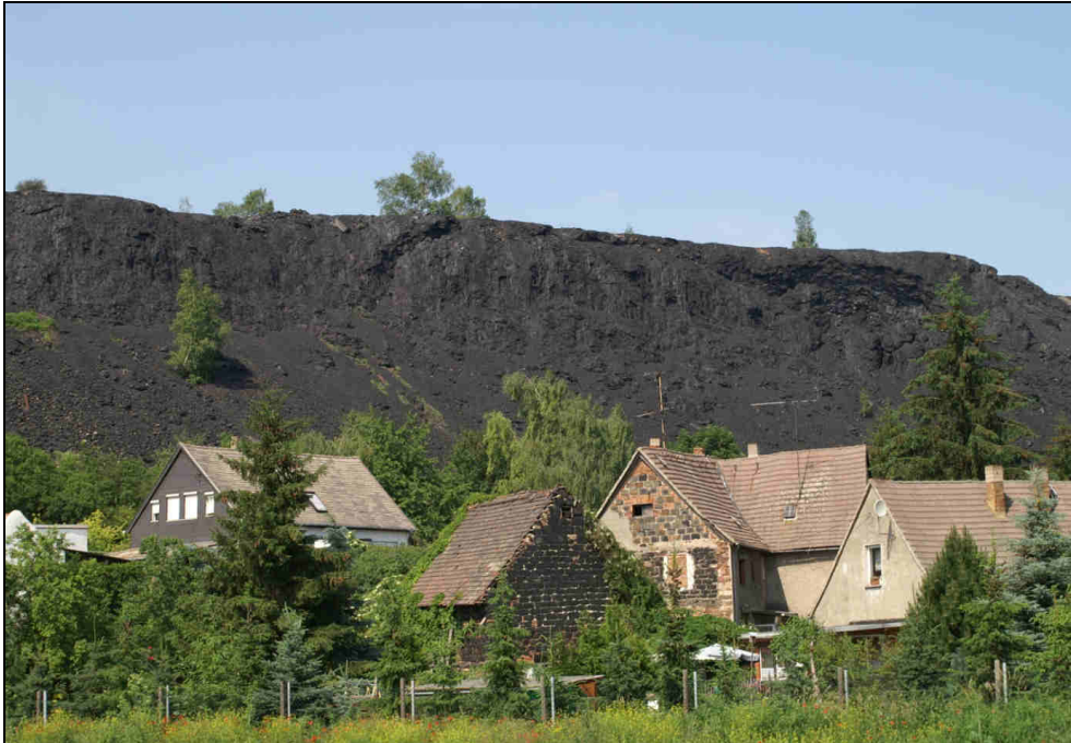
Auch 50 Jahre nach Stilllegung prägen die Schlackehalden der ehemaligen Liebknechthütte das Ortsbild von Wimmelburg.