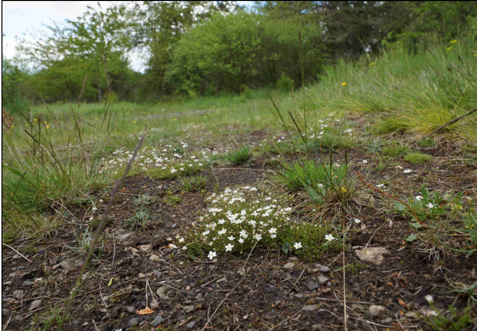
Die Frühlingsmiere, Charakterpflanze der Schwermetallrasen auf den mittelalterlichen Kupferschieferhalden (hier am Mansfelder Schlossberg).